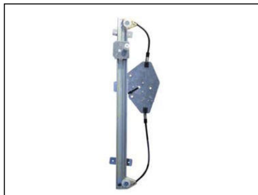
Nostro alzacristallo – our window regulator – notre lève-vitre – unser Fensterheber – nuestro elevallas – nosso levantador de vidro - bizim cam acacagi - Γρύλος δικός μας